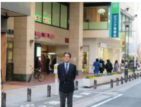
(左) ジュンク堂前の森館長