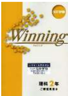
基礎クラス用教材